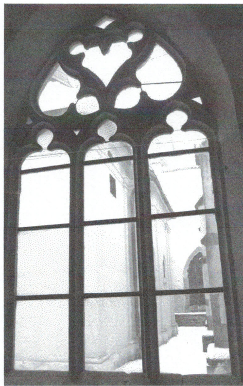
Pohled z ambitu 110127 hl 241