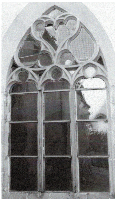
Pohled z rajského dvora 110210 hl 059

Poškozené, nevhodná náhrada kamenných prutů dřevěnými, poškozené zasklení.